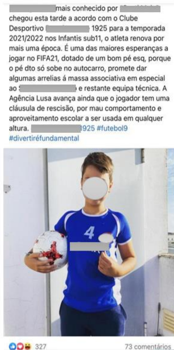
Figura II: Fotografia com o equipamento do clube partilhado por António [e1_N_pai]

Um exemplo de como a mãe partilhou mais conteúdos do que um outro pai, enquanto o pai publicou apenas uma fotografia do filho, a mãe partilhou três fotografias da família e da filha.