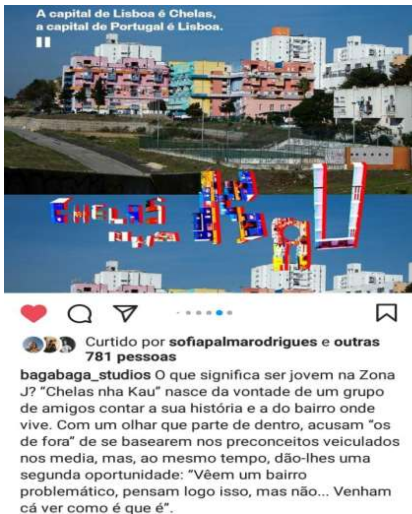
Figura 6 - Cartaz do filme Chelas nha kau

representação hegemônica do bairro, onde é difícil até mesmo pedir uma pizza, pois o local é considerado perigoso, conforme apresentado no filme. A provocação principal é que antes de falar mal de um lugar é preciso ir lá para conhecê-lo em suas diferentes facetas. Relatos e proposições desse tipo são muito comuns também na Baixada, onde é forte o questionamento sobre as ideias de centro e periferia e suas implicações nas formas de relação com a cidade. Representativo disso é a máxima “Baixada é meu país”, muito mobilizada por meus interlocutores de pesquisa do Brasil. Em Chelas nha kau também há uma reinvenção dessas noções territoriais que hierarquizam as relações na cidade, como mostra o cartaz a seguir, divulgado no Instagram da cooperativa produtora do filme.