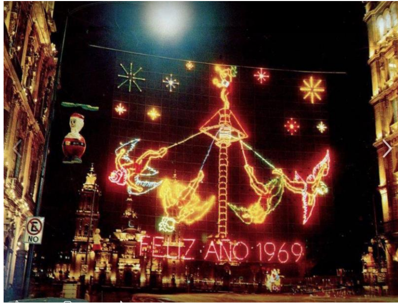
Libro "La gran capital", DDF