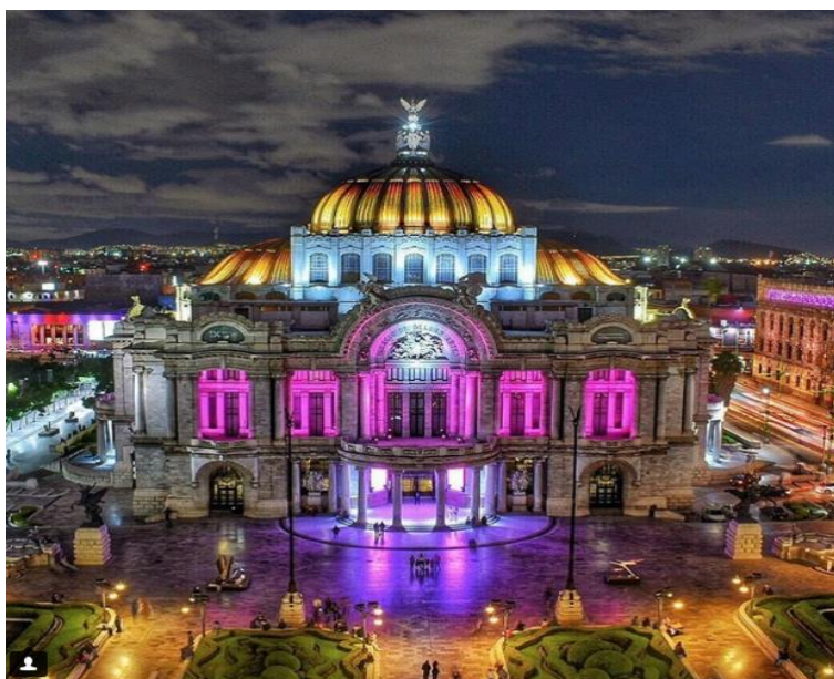
Imagen 6 - Palacio de las Bellas Artes