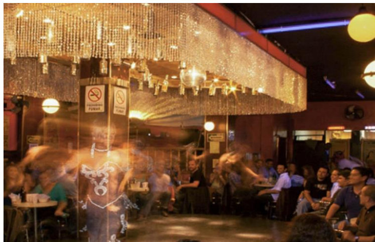
Imagen 12 - Plaza Garibaldi

“De noche todos los gatos son pardos” dice una frase popular que hace referencia que en la oscuridad nocturna todas las diferencias desaparecen. Sin embargo, en las imágenes que presentamos, pertenecer a la noche implica una singularidad, un esfuerzo por mostrarse como criatura de la noche. La vida nocturna tiene también códigos sociales compartidos y reglas de etiqueta, los vestuarios de lentejuelas y brillos complementan la ambientación de lugares de entretenimiento. La transgresión de los códigos morales, la bohemia y el ocio se presentan como posibilidades de la noche en la ciudad. Vivir la noche, practicarla, contempla tanto a los que disfrutan de la diversión y el entretenimiento como a los que lo hacen posible.