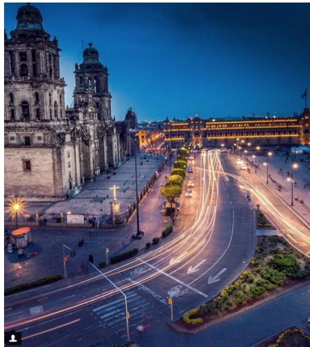
Imagen 9 - Centro Histórico de la Ciudad de México