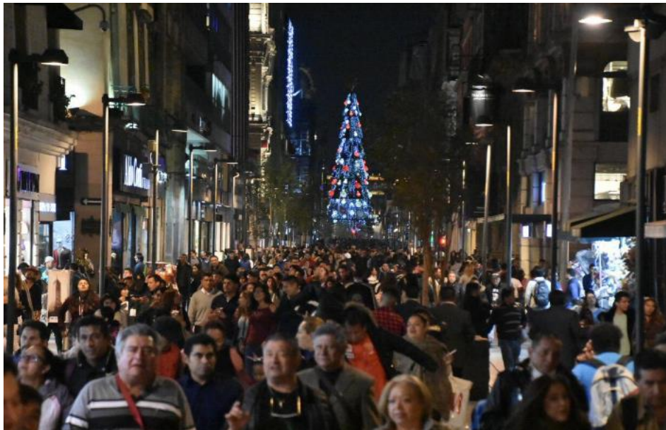
Imagen 5 - Calle Madero