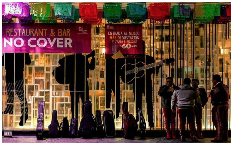
Imagen 13 - Local La Perla