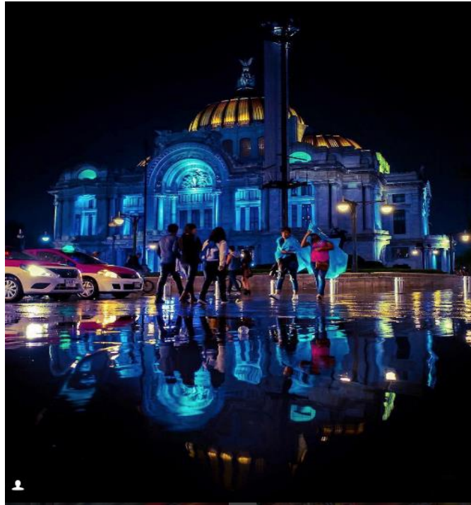
Imagen 7 - Bellas Artes, lluvia