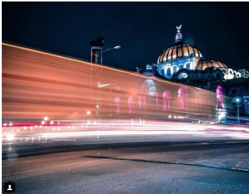
Imagen 8 - Bellas Artes y el tráfico

(2017)