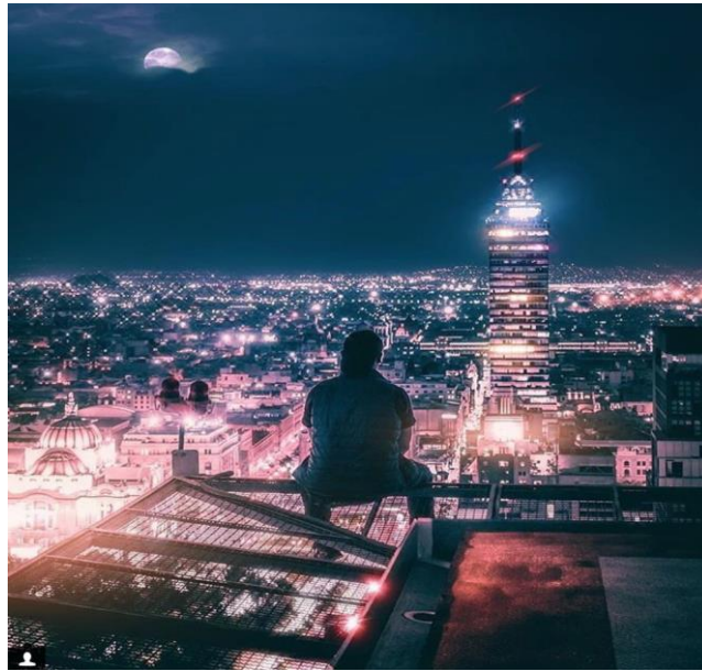
Imagen 10 - Vista del Centro Histórico